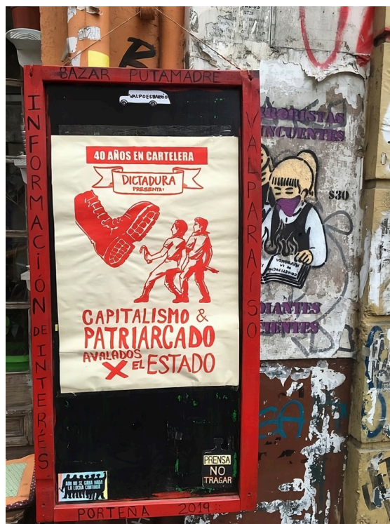
Imagen 1. Marxen (2019). Las calles de Valparaíso durante el estallido.

Son, precisamente, estos momentos de máxima incertidumbre, cuando se requiere un altísimo grado de creatividad para, primero, conceptualizar el agotamiento y, después, expresarlo con el fin de convertirlo en un nuevo mundo por venir, en “un nuevo modo de existencia” a crear. Se trata de nada menos que “inventar nuevas posibilidades de vida, nuevas formas de existir” (Pelbart, 2023, p.130).