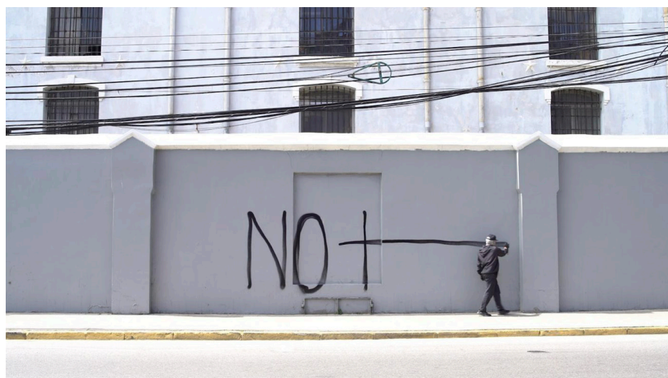
Imagen 6. Danny Reveco (2023). No +—. Frame del vídeo a 12 canales.

Exposición El lenguaje no alcanza. Parque Cultural Valparaíso.