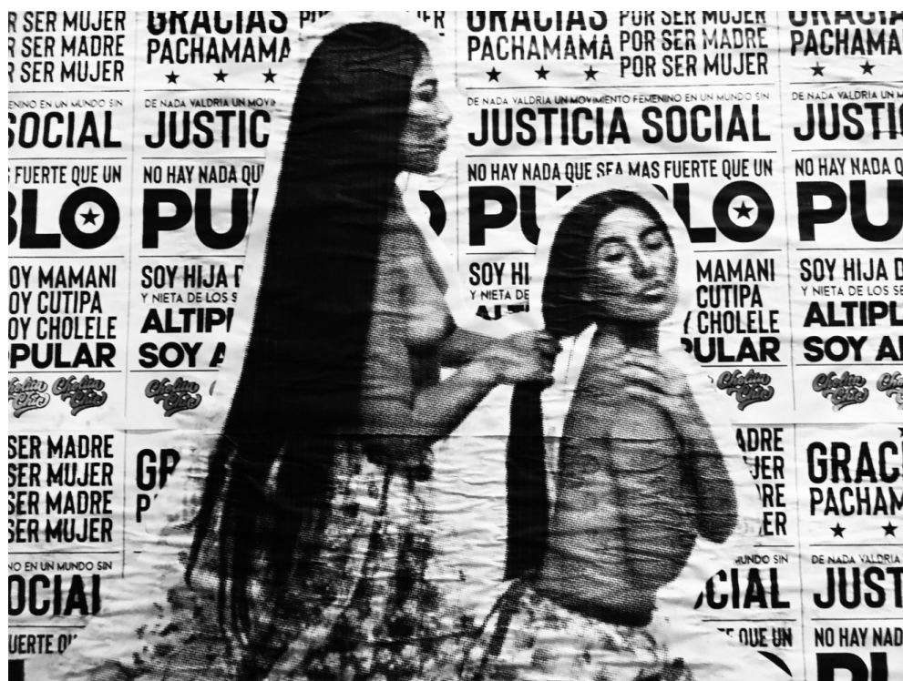
Imagen 3. Cholita Chic (2020). Mural en Arica.

En el contexto de la historia colonial y la “circulación cultural tripartita”, reivindica la belleza andina, fronteriza, migrante y aymara. “[E]n pos de empoderarnos como latinoamericanas” sus obras reflejan “fuerza, color, diversidad, sensualidad, empoderamiento, sensibilidad, apropiación de las cuerpos y resistencia ante el mandato euroblanco” (Colavitto, 2019, párr. 5). Por lo que su obra trata y discute el concepto de belleza en sí, en un contexto colonial y patriarcal.