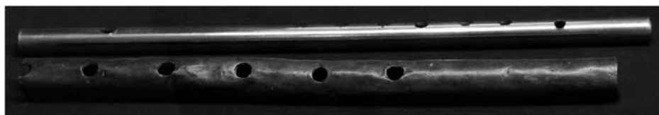
Figura 2. Pito o flautín (superior); Quena de bronce con cinco orificios (inferior).

En aquel tiempo el conjunto instrumental más utilizado en la fiesta estaba compuesto por un bombo, una caja redoblante y flautines o pitos que ejecutaban las melodías (Daponte, Díaz y Cortés 2020b) 8 . Algunas notas periodísticas de la época se refieren a “numerosas cuadrillas de individuos disfrazados con trajes más extraños y pintorescos, con sus lanzas, pitos, tamboriles, etc., [que] son objeto de gran curiosidad, animación y alegría” 9 . En 1908 El Tarapacá publicó “Estos individuos son los que transportan de un lugar a otro a la Virgen i bailan ante élla al són de flautas de caña, pitos, tambores i otros instrumentos” 10 (Figura 2).