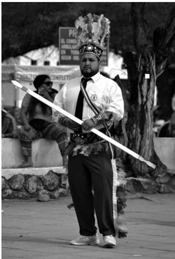
Figura 3. Chunchos de Iquique pulsando la chonta.

Como expusimos, los bailes antiguos de La Tirana eran acompañados con pito, bombo y caja, por lo que el sonido de la chonta de los chunchos se oía con más claridad, siendo parte de la orquestación. Actualmente, las bandas de bronces que acompañan a los bailes resuenan con mayor intensidad, por lo que el sonido de las chontas es opacado. Esto no impide que los bailarines mantengan la rítmica al batirlas.