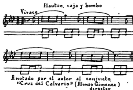
Ejemplo 4. Salto de Chunchos . Lavín (1950:33).

Según la información de Lavín, esta melodía corresponde a un salto interpretado por el conjunto Cruz del Calvario que dirigía Alonso Giménez. Está compuesta por una frase musical de ocho compases en metro de tres octavos y presenta una melodía de carácter descendente. La frase está dividida en dos semifrases de cuatro compases cada una; cada