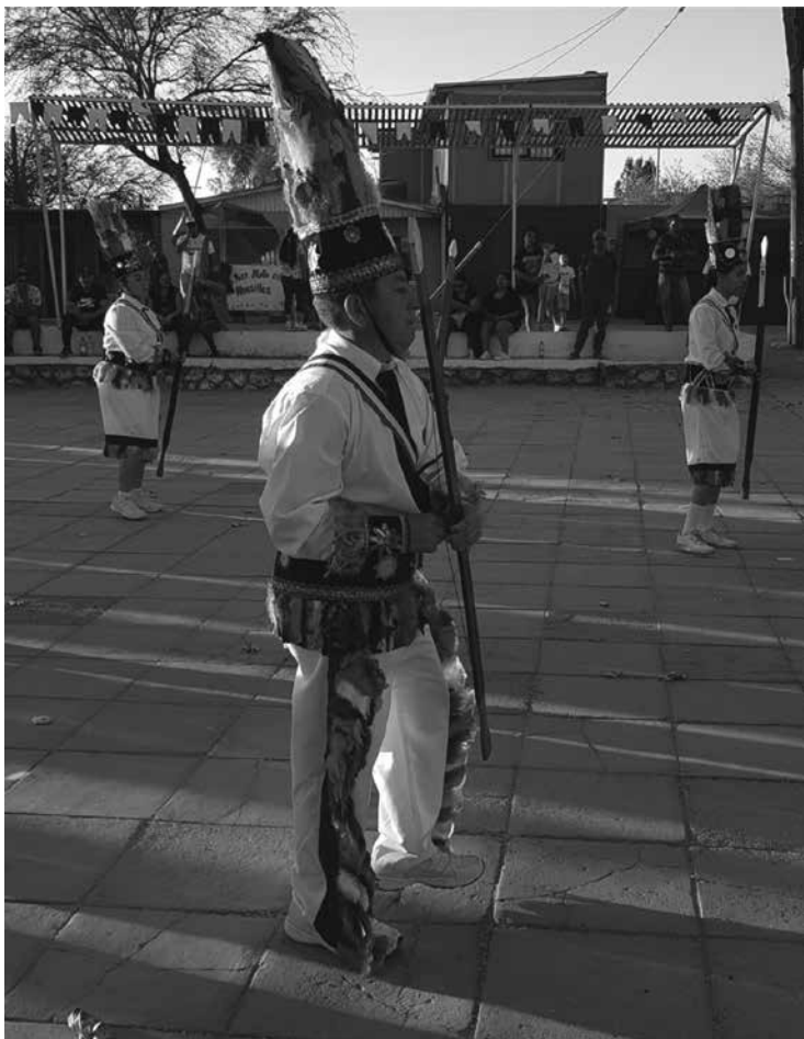
Figura 1. Chuncho del Carmen de La Tirana con lanza o chonta.

Juan Uribe-Echevarría expuso, hacia la década de 1950 aproximadamente, cómo los mismos cultores clasificaban los estilos de danza en La Tirana. Al respecto, señalaba que “los viejos caporales dividen las compañías danzantes en bailes de paso y bailes de salto [...] Los chunchos es baile tradicional de saltos y gran aparato coreográfico [...] dan largos saltos acrobáticos al tiempo que blanden un arco de chontá ” (Uribe-Echevarría 1973: 21-23) (ver Figura 1) 6 .