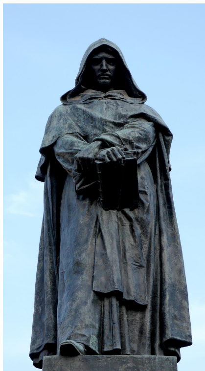
Giordano Bruno

S.Ch.F.: ¿Cómo se explica la aparición, de forma anónima, de su Tractatus theologico-politicus el año 1670?