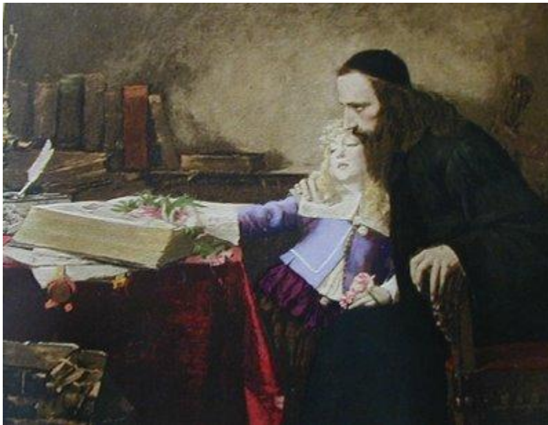
Uriel da Costa y un joven Spinoza, de Samuel Hirszenberg

H.G.: Claro que sí. Teniendo 15 años vio torturar públicamente a Uriel da Costa 1 , por sus ideas, contrarias o diversas a la tradición de esa colectividad, las cuales fueron calificadas de “materialistas y racionalistas”.