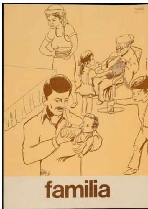
MDLE.13. Lámina educativa, familia

espacio en donde se produce y forma masivamente a los individuos, configurando así subjetividades dóciles posibles de gobernar y por tanto de dominar (Chávez, 2008).