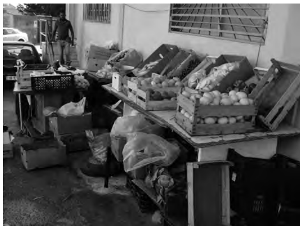
FIGURA 3: COMÉRCIO DE FRUTA NA RUA PRINCIPAL (11/10/2013).