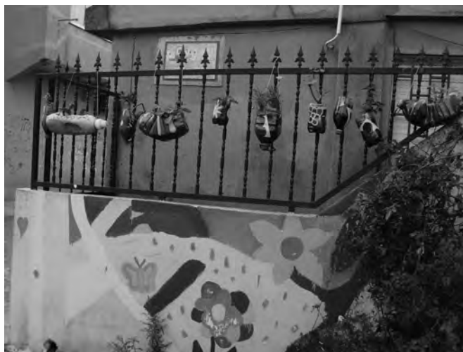
FIGURA 14: PLANTAÇÃO EM GARRAFAS DE PLÁSTICO (05/09/2013)

Convém salientar que a vontade de ultrapassar o estigma não faz dos habitantes pessoas arrogantes, pelo contrário, apresentam uma grande humildade, fazendo uma vida com base em valores não materiais ou monetários, mas em amor ao seu bairro e felicidade da sua família 86 . A Cova da Moura é hoje um dos poucos locais em Lisboa onde as pessoas se cumprimentam na rua, dando os bons dias, ou as boas tardes, mesmo não se conhecendo.