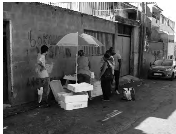
FIGURA 4: COMÉRCIO DE PEIXE NA RUA PRINCIPAL (10/10/2013).