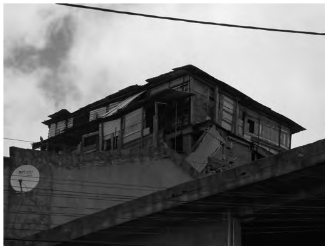
FIGURA 2: PATRIMÓNIO EDIFICADO DEGRADADO NO BAIRRO (15/06/2010).

Casas, na sua maioria de imigrantes, entre o pragmatismo e a alegria; entre as formas modelares “modernas”, propostas pela racionalização do betão (topos de laje, palas, pilares, vigas arrastadas de dentro, vãos rectangulares) e uma intuição construtiva e estrutural quase “natural” (cachorros, capitéis, escoras, tirantes, balanços sobre a rua).