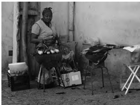
FIGURA 5: COMÉRCIO DE ESPIGA DE MILHO VERDE ASSADO NA RUA PRINCIPAL (10/10/2013).