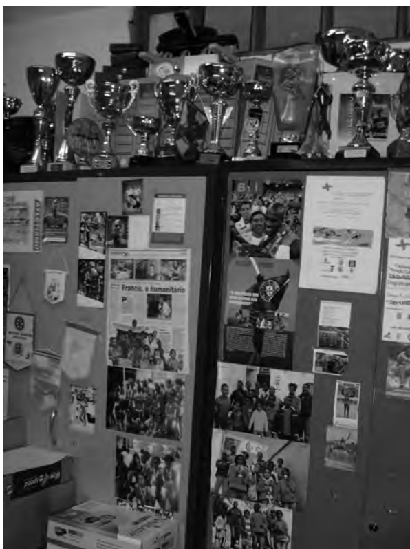
FIGURA 12: TÍTULOS DESPORTIVOS CONQUISTADOS POR ATLETAS COM LIGAÇÃO À ACMJ (14/06/2010).