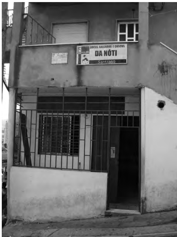
FIGURA 9: DOCES SALGADOS E CUSCUZ (15/06/2013).