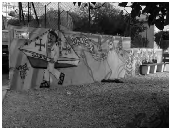
FIGURA 11: PINTURA ALUSIVA À FESTA “KOLÁ S. JON”, REALIZADA EM 2013 PELA ACMJ NUM MURO LOCALIZADO NO INÍCIO DA RUA DO MOINHO (17/10/2013).