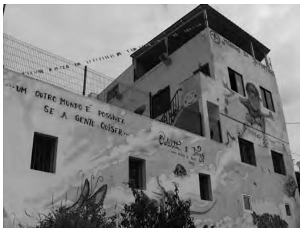
FIGURA 7: FACHADA (TRASEIRA) DO EDIFÍCIO DA ACMJ (15/06/2013).

2003 70 , desenvolvido pela ACMJ, com algum apoio financeiro do Alto Comissariado para a Imigração e Diálogo Intercultural, I.P. (ACIDI), que alterou o paradigma do turismo étnico em Portugal, até essa altura muito incipiente 71 e representou os alicerces