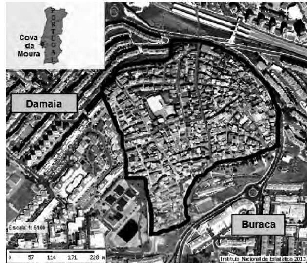
FIGURA 1: LOCALIZAÇÃO GEOGRÁFICA DO BAIRRO DA COVA DA MOURA, NA FREGUESIA DA DAMAIA E DA BURACA.