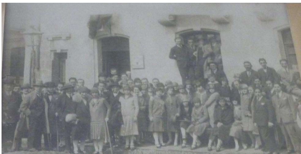
1925: Calle Ñuble 1020, Santiago, primer lugar donde funcionó el Policlínico (foto colgada en una oficina del Policlínico y tomada desde allí por la autora el 8/7/2021)