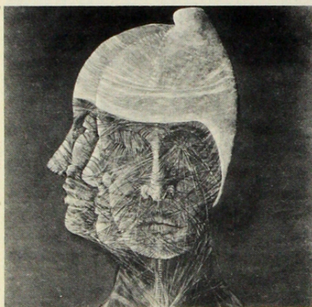
"Serie animal humano" (acrílico tela) 1976 BENJAMÍN LIRA.

Se advierte en las artes plásticas el anhelo común de pintores, escultores, dibujantes y grabadores de vincularse estrechamente, a través de sus quehaceres, con la vida misma.