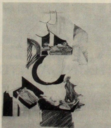
“Serie de la intimidad - La Anunciación” (técnica mixta) 1976 EDUARDO GARREAUD.

frontal. Rompe, además, con la lógica continuidad volumétrica. Sus formas se ofrecen sorpresivamente a la contemplación, sin que sea posible determinar un frente y un atrás. Esta organización del volumen se vincula indisolublemente con las temáticas que propone, buscando la síntesis orgánica entre elementos antagónicos: lo humano y lo mecánico, lo primitivo y lo contemporáneo.