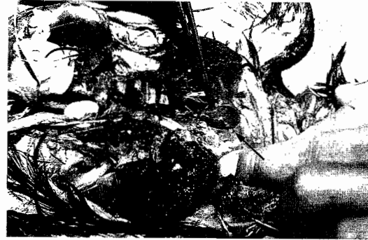
Fig. 1. Glándula tiroides severamente aumentada de tamaño en una paloma de raza "Buchona Española". La glándula alcanza 2cm de largo por 1 cm de ancho.

El aumento no neoplásico del tamaño de la glándula tiroides ha sido descrito en palomas anteriormente. En estas aves los signos clínicos de la enfermedad han sido asociados a una hipofunción de la glándula (apatía, obesidad, depósitos grasos, desarrollo anormal de las plumas, myxedema facial y disminución de la fertilidad) y en algunos casos al aumento de tamaño de la misma (dificultad respiratoria por compresión traqueal) (Hollander y Riddle, 1946). En el presente caso el ave sólo presentaba signos de disnea y de abatimiento (que pueden atribuirse a distrés respiratorio), faltando los otros signos que generalmente se presentan en palomas con esta enfermedad. De esta forma, el cuadro descrito se asemeja clínicamente más a comunicaciones realizadas en catitas australianas, en las que los signos clínicos, que se limitan a rejugitación y disnea, son causados por la compresión que ejerce la glándula sobre la tráquea y el esófago. A veces se observan problemas circulatorios debidos a compresión del corazón y grandes vasos, sin evidenciarse signos específicos de hipofunción tiroidea (Oglesbee y col, 1997; Blackmore, 1963).