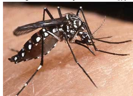
Figura 1. Fotografía del mosquito Aedes aegypti

El ciclo de transmisión del virus del dengue se realiza mediante el mosquito Aedes aegypti (Figura 1). Una persona infectada posee el virus circulando en su sangre, por aproximadamente cinco días. Durante este tiempo, un mosquito hembra pica a la persona y se infecta al ingerir sangre que contiene el virus. Inmediatamente, el virus se replica dentro del mosquito, de ocho a doce días (Marcano-Pasquier, 2010). Luego, el mosquito durante toda su vida puede transmitir el virus a las personas susceptibles. El virus se replica en la segunda persona y produce síntomas, los cuales comienzan a aparecer, en promedio de cuatro a siete días después de la picadura de mosquito, con un rango de tres a 14 días. La viremia comienza algo antes de la aparición de los síntomas y estos pueden durar de tres a 10 días, con un promedio de cinco días y pueden persistir durante varios días después de haber concluido la viremia.